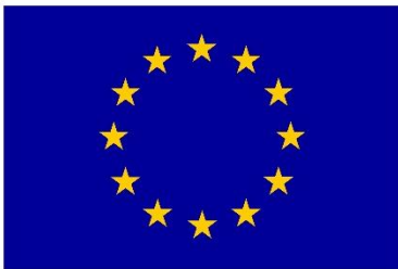
Euroopa Liit Euroopa Sotsiaalfond

Projekti eesmärk: lapsevanemate tööturul osalemise suurendamine läbi täiendavate lasteaiakohtade loomise – Muhu Lasteaias 4. rühma avamine.