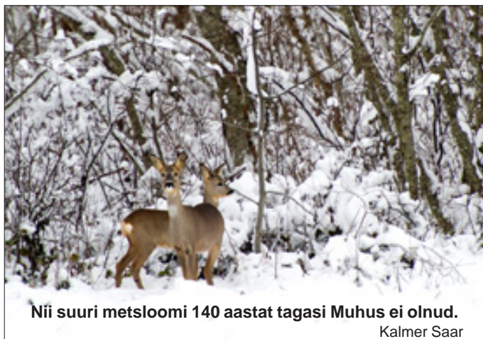
Nii suuri metsloomi 140 aastat tagasi Muhus ei olnud.

Muhusoare keskelt käib kroonu sild läbi. Selle silla peale tuleb igast küljest palju teiisi sildu. Kroonu sild läheb õhhta poolt omingo poole, se on Wahtnast Kuiwastu. Kuiwastu on üks suur jäema koht Muhus: sõnna jäewad meremassinad seiisma, seal on iga sui Innlismanni, Soome, Lätti, Wene ja Eesti kaubalaewad kauplemas, naad wiiwad Muhust willja (otre, rukisi ja muud), liha, wõid, (ja) elajud ja kalu. Muhulastele ei tohi naad omalt maalt midagid tuwa. Muhulased peawad kõik kauba kaupmeste käest ostma, selle järel oatawad rüütliid, neiid on