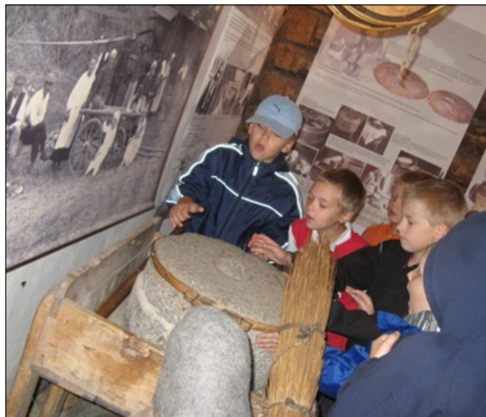
Koolijütsid Koguvass leivapäeva pidamas (vt ka lk 6).