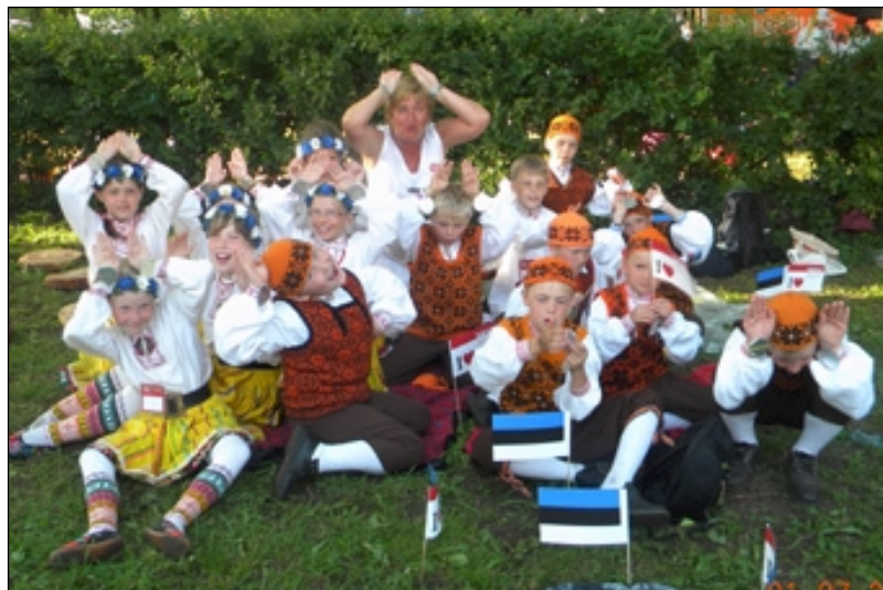
Suvine tantsupidu koos väikeste muhulastega.