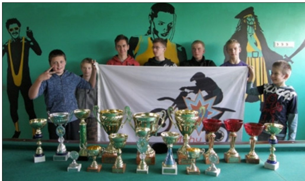
Motoring oma selle aasta "saaki" demonstreerimas.