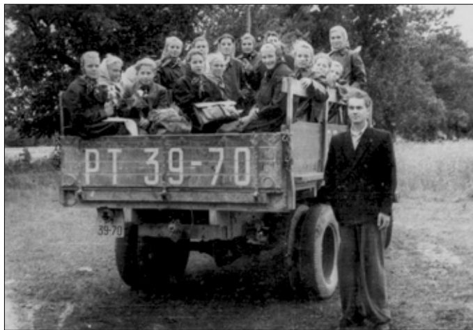
Saaremaa ekskursioon 10.-11.augustil 1958.

Kooli pedagoogilise nõukogu koosolekute protokolle lugedes on tore tõdeda, et mõned probleemid on koolis igavesed, kuigi tavaliselt öeldakse, et tänapäeva noorus on hukas ja meie omal ajal olime küll vaiksemad, korralikumad, kartsime õpetajaid ja nii edasi. Viimati kuulsin ma sellist juttu ühe 19-aastase noormehe suust. 1957. aastal oldi Piiri koolis hädas noormehega, kes õppenõukogu protokollil kohaselt „Puudus põhjusetult koolist, õppetundideks ette ei valmistunud /.../ õppetööst osa ei võtnud, vaid segas kaas-