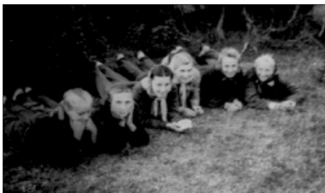
1958. aasta Saaremaa ekskursioonilt.