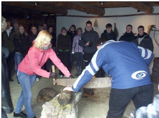
Kaheinimese saega polegi nii lihtne...

30. aprillil kell 19 tulge kõik Koguva Vanatoale, kus maailma-