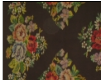
Fragment seinavaibast Hellamaa külakeskuses.

Teine inimene arwab, et kohalikule näitusele ei saa ta oma mudeleid sellepärast välja panna, et need on tema ise oma ideede põhjal välja töötanud. Kui need nüüd näitusele tuua, hakkab keegi neid kindlasti järele tegema ja hea äriplaan ongi tuulde lastud. Mõnes mõttes on tal õigus – nutikaid ja hästi müüvaid „müügiartikleid“ ollakse üsna väledad oma toodangu hulka juurutama. Nii mõnigi tüli on sel pinnal üles kerkinud. Siinkohal saab käsitööst äri.