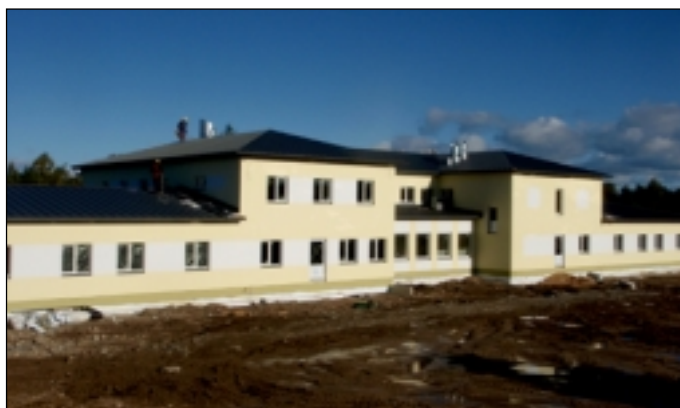
Muhu ja Ida-Saaremaa Sotsiaalkeskuse ehitustööde seis 26. september 2013