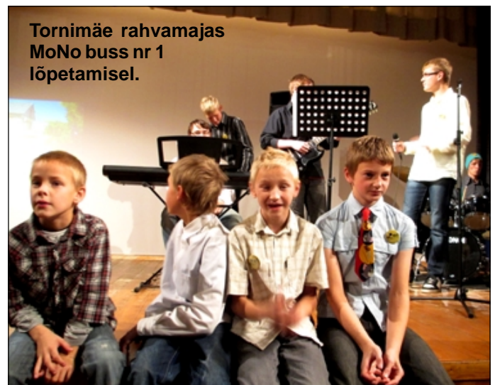
Tornimäe rahvamajas MoNo buss nr 1 lõpetamisel.