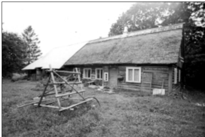
Kelle majapidamine võiks Endel Viidingu tehtud pildil olla?